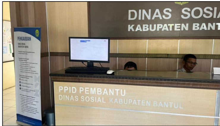
Gambar 1. Front office