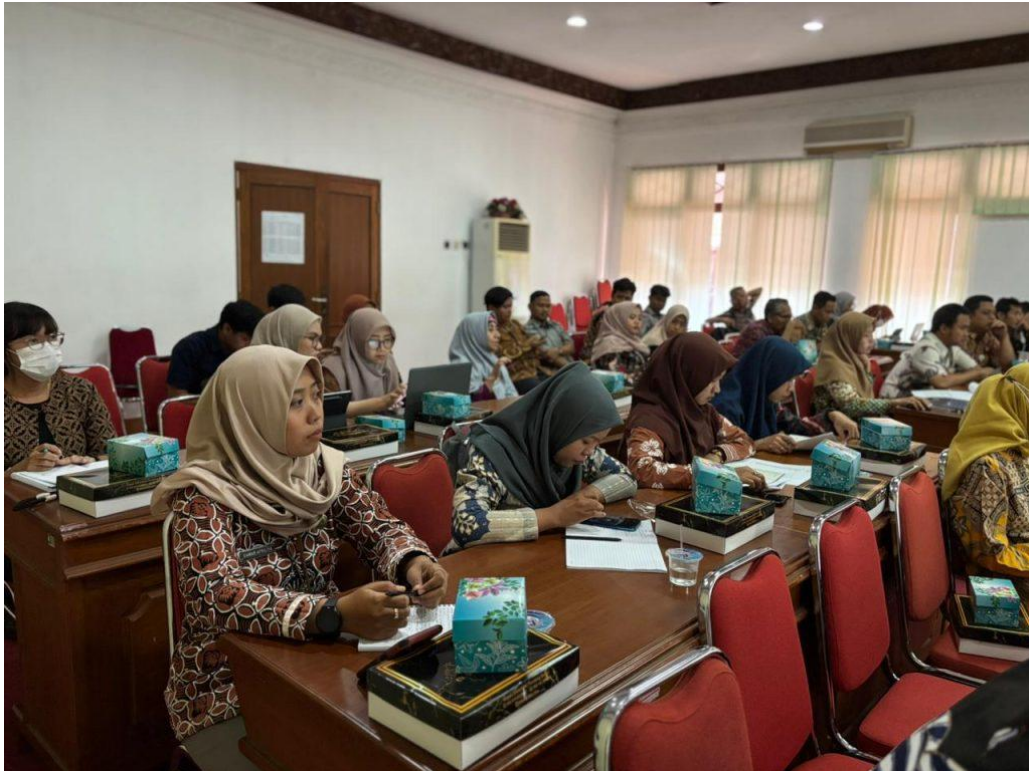
Dokumentasi Pendampingan Monev Keterbukaan Informasi Badan Publik Kabupaten Bantul Tahun 2025