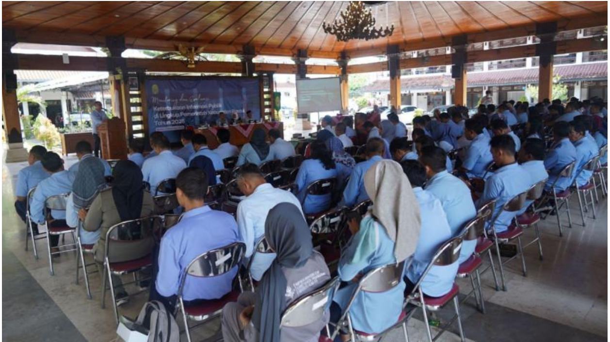
Dokumentasi Monitoring dan Evaluasi Keterbukaan Informasi Badan Publik di lingkungan Pemerintah Kabupaten Bantul Tahun 2025