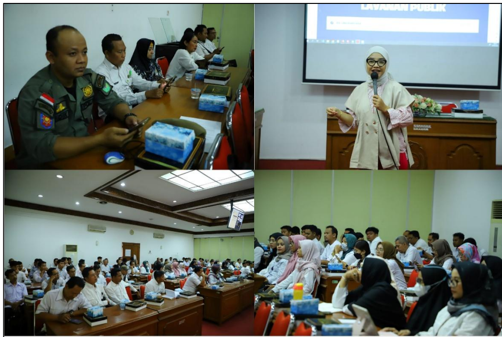
Dokumentasi Workshop Peningkatan Kapasitas Pejabat Pengelola Informasi dan Dokumentasi (PPID) dengan Tema "Optimalisasi Media Sosial dalam Mendukung Layanan Informasi Badan Publik"