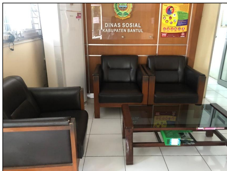
Gambar 2. Ruang tunggu pelayanan