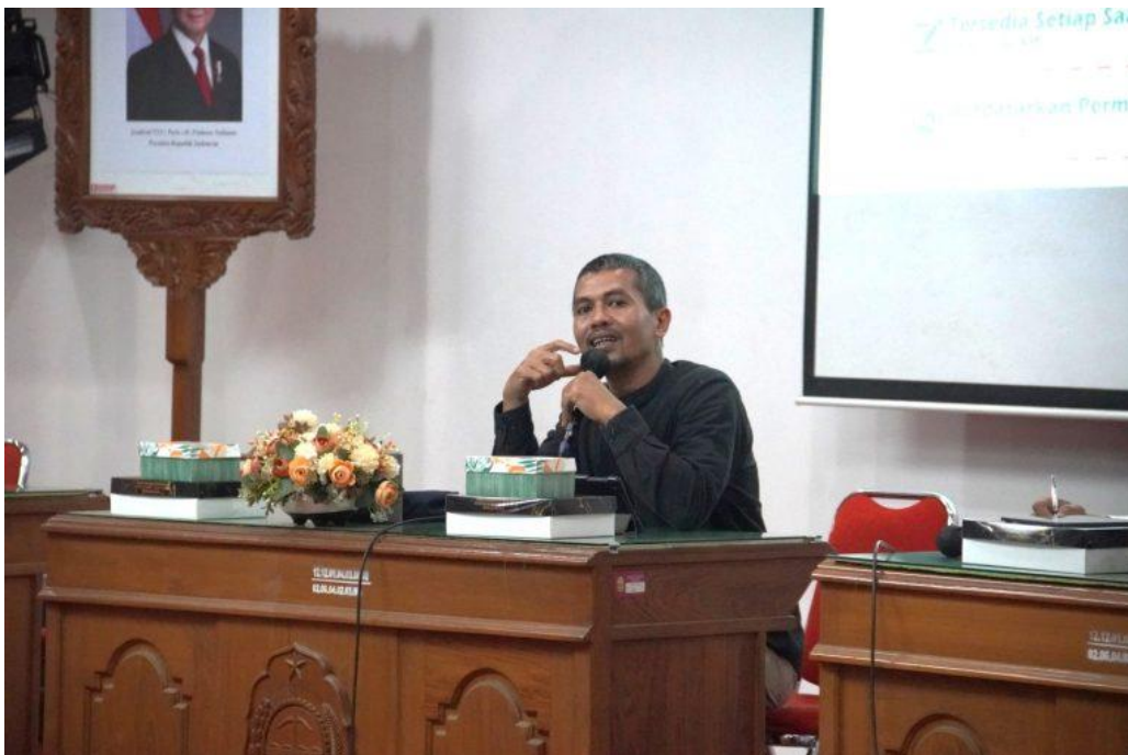
Dokumentasi Sosialisasi Monev Keterbukaan Informasi Badan Publik Kabupaten Bantul Tahun 2025