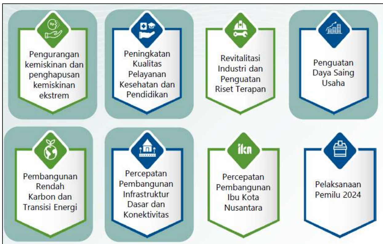
Gambar 3.1 Arah Kebijakan RKP Tahun 2024

Pada Tahun 2024, Tema Pembangunan Nasional yang ditetapkan dalam RKP Tahun 2024 adalah "Mempercepat Transformasi Ekonomi yang Inklusif dan Berkelanjutan" dengan 8 arah kebijakan sebagai berikut: